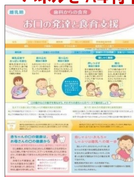
表 ① 妊娠期 マイナス1歳からの口腔ケア

歯科保健指導用パネル2枚をそのままA4判の表裏に縮小しました。手元においていつでも見られる配布用教材としてお勧めです！