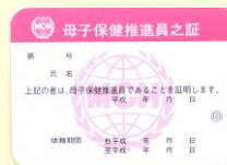
表: 身分証明証 裏: 母子保健推進員の心得 ビニールケース付き 100円 * 首から提げるストラップ付 ケースの場合は 250円